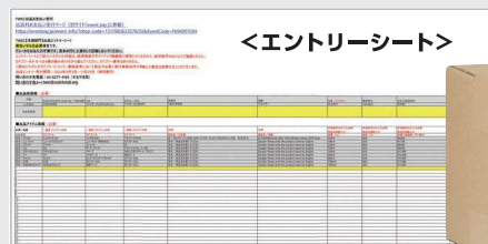
<エントリーシート>